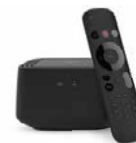
MagentaTV Box **