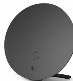
Speed Home WLAN

Sie haben schon einen aktuellen Router wie z. B. den Speedport Smart 4 oder Speedport Pro Plus und möchten Ihr WLAN optimieren? Dann sind unsere WLAN Pakete genau das Richtige für Sie. Sie ermöglichen, zusammen mit einem geeigneten Router, in Ihrem Zuhause eine optimale WLAN-Abdeckung mit Wi-Fi-6-Standard und Mesh-Technologie. Unterstützung bei der Installation und der WLAN-Optimierung ist ebenfalls inklusive.