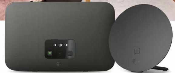
Speedport Smart 4