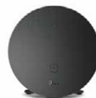
Speed Home WLAN

* Extraleistung bei Miete: MagentaZuhause App Pro (verfügbar ab Ende März) und schneller Gerätetausch bei Defekt inklusive.